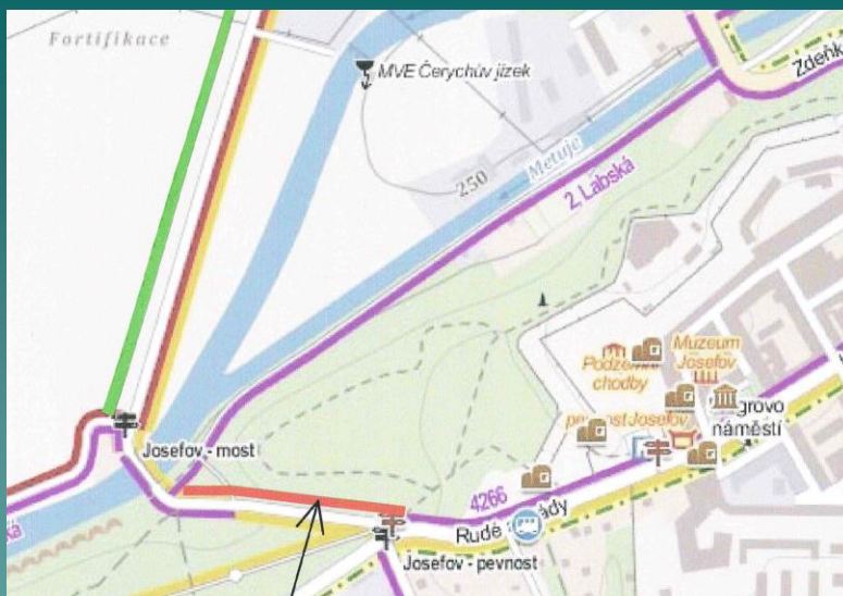
Situační mapka plánované trasy